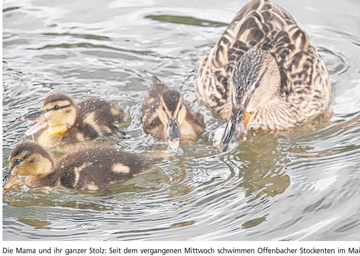
Die Mama und ihr ganzer Stolz: Seit dem vergangenen Mittwoch schwimmen Offenbacher Stockenten im Main bei Erlach.

Gefasst war der Vorsatz schnell - nur, die Stockentemama einzufangen, das stellte sich für Roth zu-